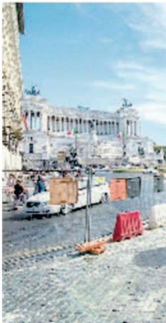
Lavori a piazza Venezia

PER I BANDI DI GARA PIÙ IMPORTANTI ATTESO IL VIA LIBERA DELL'ANTICORRUZIONE: DISAGI IN VISTA PER LA CIRCOLAZIONE