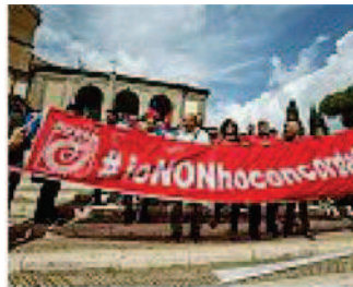
In piazza Sindacati protestano